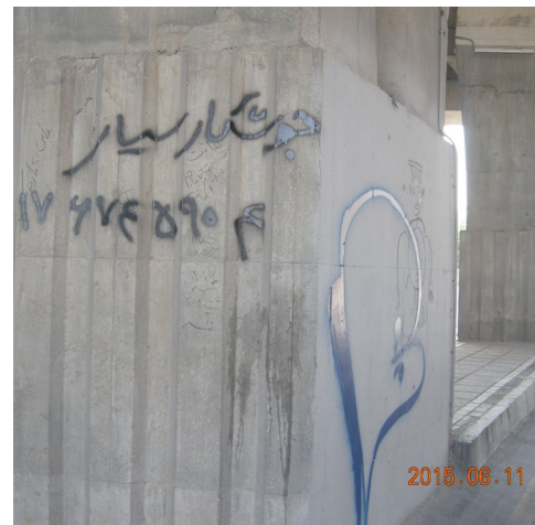
شکل ۴. اجرای پوشش مقاوم سیمانی ضد آب بر روی سطح بتنی عمودی، تصویر سمت راست قبل از اجرا و تصویر سمت چپ بعد از اجرا Figure 4. Application of Water-Resistant Cement Plaster on a vertical concrete surface (right: before application, left: after application)