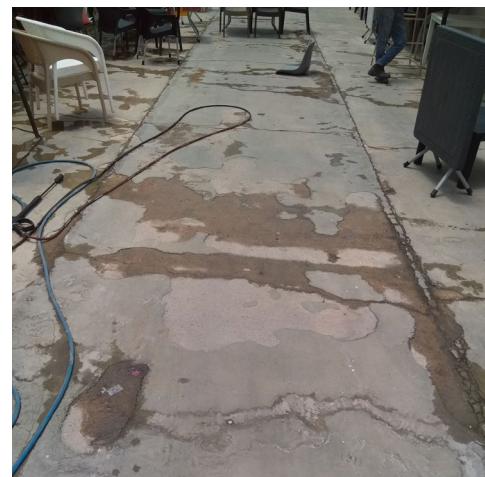
شکل ۵. اجرای پوشش مقاوم سیمانی ضد آب بر روی سطح بتنی افقی، تصویر سمت راست قبل از اجرا و تصویر سمت چپ بعد از اجرا Figure 5. Application of Water-Resistant Cement Plaster on a horizontal concrete surface (right: before application, left: after application)