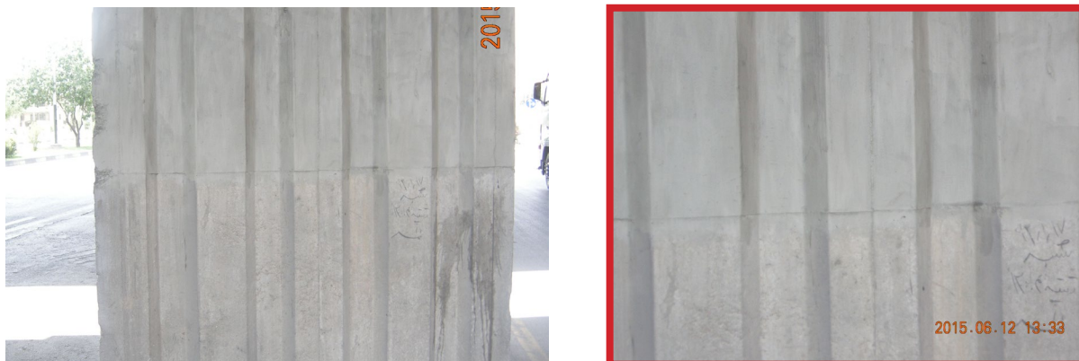
شکل ۳. اجرای پوشش مقاوم سیمانی ضدآب بر روی سطح بتنی (محدوده کادر قرمز رنگ تصویر سمت چپ) بزرگ‌نمایی مرز بین پوشش مقاوم سیمانی ضدآب و سطح بتن طبیعی (تصویر سمت راست)

محصول نهایی به‌صورت خمیر آماده مصرف ارائه شده و در بسته‌بندی‌های سطل‌های ۱۰ کیلوگرمی با ماندگاری دوماهه عرضه می‌شود. هر واحد بسته‌بندی قابلیت پوشش‌دهی حدود ۱۰ مترمربع سطح صاف را داراست.